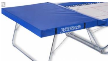
Zusatzrahmengestell Universal mit Auflagematte