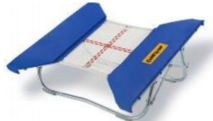
Minitramp open end