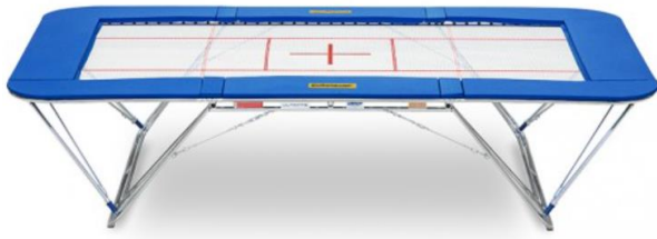
Ultimate 4 x 4