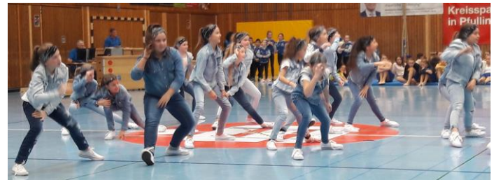
TSV Sondelfingen, xxs group

Für die Durchführung der Veranstaltungen hat jeder teilnehmende Verein einen Kampfrichter/in mit gültiger Dancelizenz auf eigene Kosten zu stellen. Eine Teilnahme ohne Kampfrichtermeldung ist nicht möglich. Vereine ohne eigenen Kampfrichter können sich zwecks Zuteilung an Dance@stb-gruppenwettkaempfe.de wenden Siehe auch fachliche Bestimmungen Broschüre „Dance im STB 2020“, unter ( www.stb.de , Sportarten, Gruppenwettkämpfe, Ausschreibungen der Wettkämpfe, Wettkämpfe und Wettbewerbe Dance