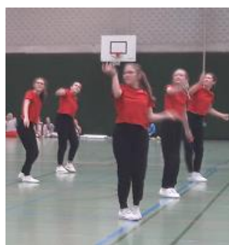
TSV Flacht, Heartbreaker