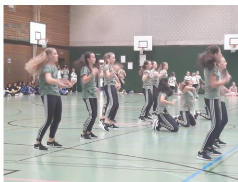
TB Beinstein, dance mix