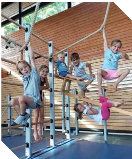
Der TV Altbach sammelte im Rahmen der Spendenaktion Kinderturnen 2021 für neue Geräte für ihre Kinderturngruppen.

nikationskanäle genutzt werden – online wie offline: Social-Media-Kanäle sollten regelmäßig bespielt werden, das heißt zum Start, zum Ende und zum Zwischenstand der Spendenaktion. Parallel sollte natürlich auch die Website aktuell gehalten werden. Flyer mit QR-Code zur Spendenaktion können ausgehängt und verteilt werden. Private Kanäle wie Social-Media-Accounts und Whatsapp-Kontakte können genutzt werden und so Vereinsmitglieder, Bekannte und Verwandte sowie örtliche Institutionen angesprochen werden. Je mehr Menschen über das Spendenprojekt wissen, desto besser! Je aktiver der Verein in der Kommunikation ist, desto größer ist der Spendenerfolg.