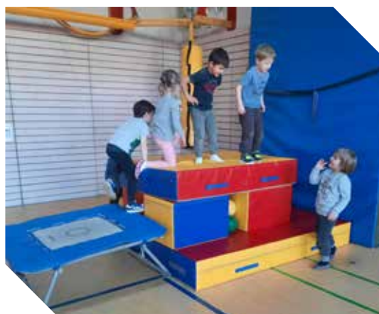
Spvgg Besigheim sammelte Spenden für bunte Weichböden.

Bei der Texterarbeitung gilt es darauf zu achten, dass kurz, verständlich, emotional und bildhaft dargestellt wird, warum das Spendenprojekt so wichtig ist. Bei der Bildauswahl gilt der Spruch: „Ein Bild sagt mehr als tausend Worte“. Dabei muss es sich nicht immer um Personen handeln. Auch ein selbst gemaltes Bild, eine Kollage oder eine Grafik können gut wirken – Kreativität ist gefragt!