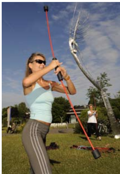
Gesundheit und Fitness sind heutzutage die Hauptmotive beim Sporttreiben von Erwachsenen.

Auch hier ist ein Blick auf die Vorausberechnung des Statistischen Landesamtes interessant. Es geht davon aus, dass sich der Trend der zunehmenden Verstädterung fortsetzt. Vor allem junge Menschen ziehen zur Ausbildung, Studium oder für