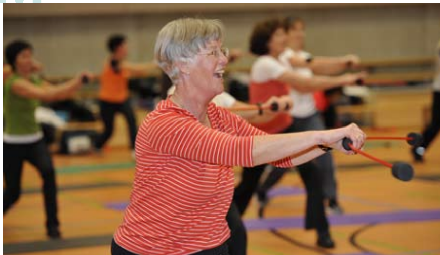
Aufgrund der demografischen Entwicklung werden die Älteren eine immer größere Gruppe, gleichzeitig aber fitter und verlangen nach entsprechenden Angeboten.

Seit nunmehr vier Jahren ist der Rückgang der Geburtenrate auch bei den Mitgliederzahlen im Kinderturnen angekommen.