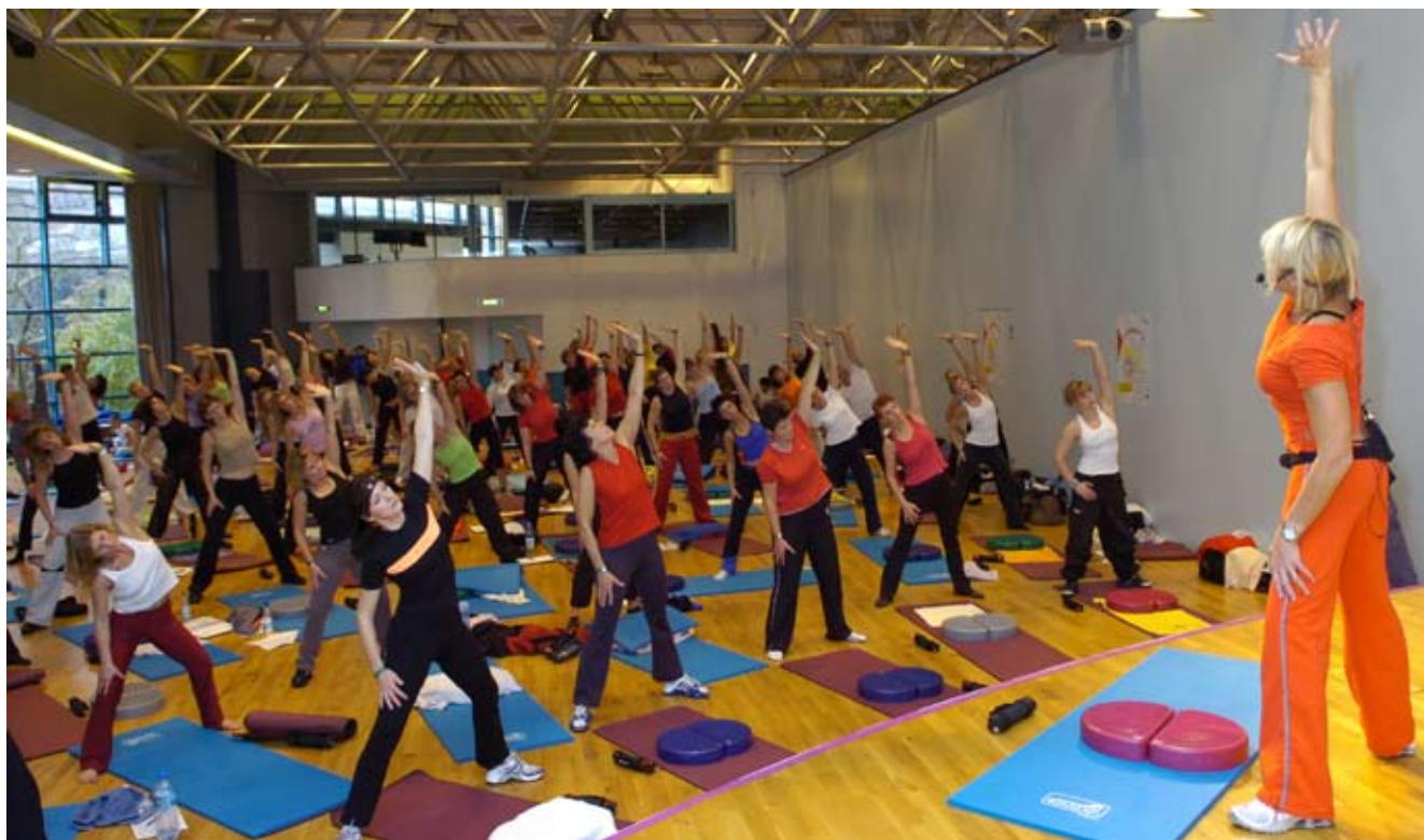
Frauen und Mädchen machen seit vier Jahrzehnten die größte Mitgliederfraktion in Vereinen des Schwäbischen Turnerbunds aus. Entsprechend umfangreich und vielfältig präsentiert sich das Angebot in den Vereinen.

men. Mit 77.291 Kindern im Vorschulalter sind rund 10 % weniger Kinder in unseren Turnvereinen und -abteilungen gemeldet als noch im Jahr 2005.